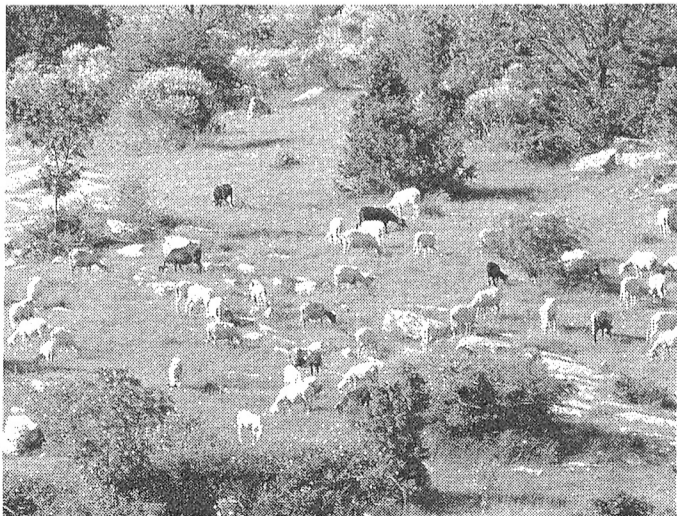
Pecore al pascolo in Calvana